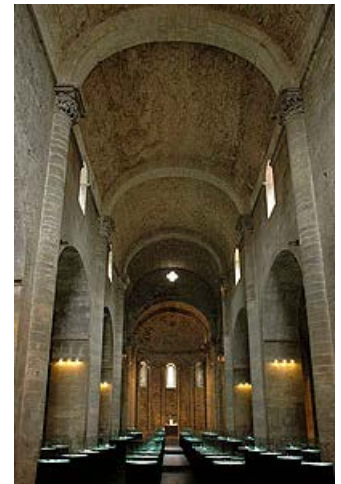
La nave central