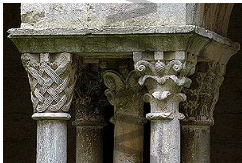
Grupo de capiteles del claustro