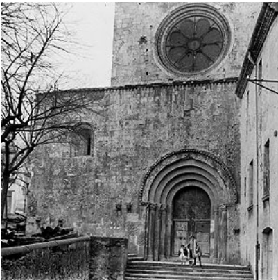
Sant Pere de Galligants

El monasterio de Sant Pere de Galligants ejercía la jurisdicción civil y criminal sobre el arrabal de Sant Pere, que se extendía a su alrededor. Durante la primera mitad del siglo XII se construyó la iglesia románica actual, sustituyendo una anterior. Más adelante el burgo de Sant Pere y el mismo monasterio fueron rodeados por una muralla que hizo levantar Pere el Ceremonioso en 1375, esta obra afectó a la cabecera de la iglesia que sirvió de defensa de la ciudad en este sector.