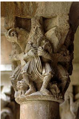
Capitel fantástico con una figura humana