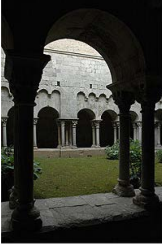
Claustro de Sant Pere de Galligants