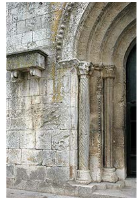
Portada de la iglesia