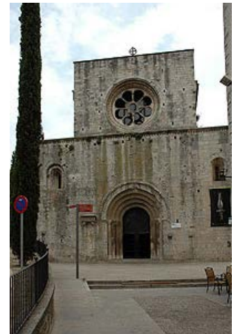
Sant Pere de Galligants

No se dispone de noticias exactas de la fundación de este monasterio, el primer documento que hace referencia a él es del año 988, y se menciona este lugar como beneficiario de una donación de bienes. Más adelante aparece en varias ocasiones con motivo de nuevas donaciones. En el siglo XII, concretamente en el año 1117, Sant Pere de Galligants fue anexionado por el monasterio de Lagrasse (Languedoc-Rosellón) según lo que se estableció en un documento firmado por Ramón Berenguer III, unión que más adelante confirmó el papa Gelasio II. A pesar de esta dependencia del monasterio del Carcassès, Galligants continuó teniendo cierta autonomía y abades propios, pero parece que este vínculo tampoco duró mucho tiempo.