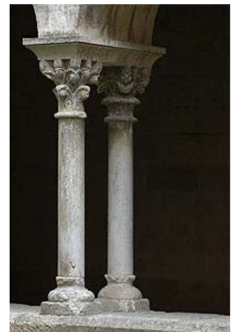
Columnas del claustro