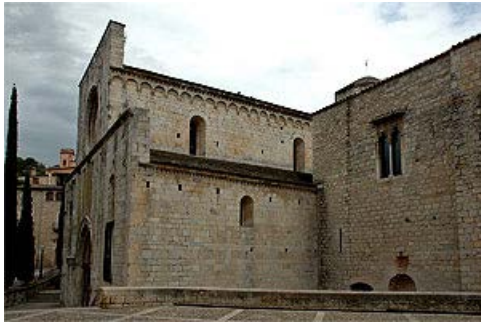
Sant Pere de Galligants