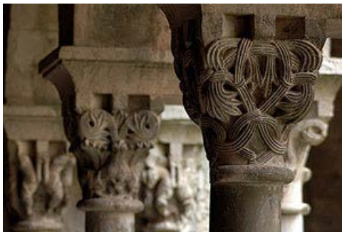
Capitel con entrelazos