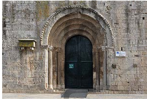
Portada de la iglesia

El monasterio de Sant Pere de Galligants ejercía la jurisdicción civil y criminal sobre el arrabal de Sant Pere, que se extendía a su alrededor. Durante la primera mitad del siglo XII se construyó la iglesia románica actual, sustituyendo una anterior. Más adelante el burgo de Sant Pere y el mismo monasterio fueron rodeados por una muralla que hizo levantar Pere el Ceremonioso en 1375, esta obra afectó a la cabecera de la iglesia que sirvió de defensa de la ciudad en este sector.