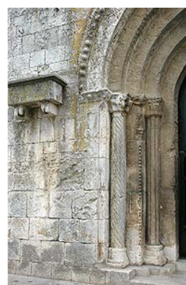
Portada de l'església