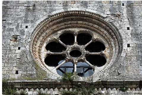
Rosassa a la façana principal