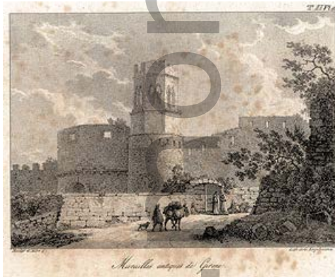
Murailles antiques de Girona Gravat de L. Bacler D'Albe, 1798 Institut Cartogràfic de Catalunya

Del conjunt monàstic es conserven l'església i el claustre d'època romànica, s'ha perdut la resta de dependències. El que encara queda és de difícil interpretació i datació a causa de les intervencions i reparacions fetes en el decurs de la seva història, les muralles, avingudes, guerres... L'església és de planta basilical amb tres naus; té un transepte irregular: al sud s'obren dues absidioles, al nord dues més però disposades de manera diferent: una a llevant i l'altra al nord. En aquest braç del transepte s'aixeca el campanar, de planta octogonal. Interiorment l'església conserva alguns capitells historiatats que s'han volgut vincular al Mestre de Cabestany. A la façana de ponent, es troba la portada que s'ha vist com un element anterior a la fàbrica de l'església actual; sobre seu es troba una rosassa que podria situar-se a cavall dels segles XII i XIII.