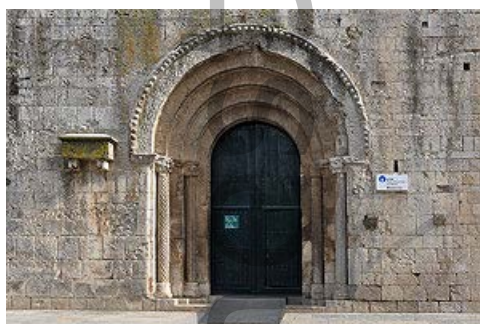
Portada de l'església

El monestir de Sant Pere de Galligants exercia la jurisdicció civil i criminal sobre el raval de Sant Pere, que s'estenia al seu voltant. Durant la primera meitat del segle XII es va construir l'església romànica actual, substituint una anterior. Més endavant el burg de Sant Pere i el mateix monestir foren envoltats d'una muralla que va fer aixecar Pere el Cerimoniós el 1375, aquesta obra va afectar la capçalera de l'església que va servir de defensa de la ciutat per aquest sector.