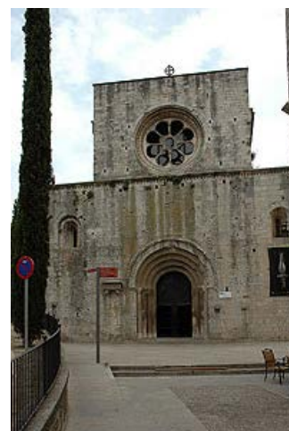
Sant Pere de Galligants

No es disposa de notícies exactes de la fundació d'aquest monestir, el primer document que en fa referència és de l'any 988, i s'esmenta aquest lloc com a beneficiari d'una donació de béns. Més endavant apareix en diverses ocasions amb motiu de noves donacions. Al segle XII, concretament l'any 1117, Sant Pere de Galligants fou annexionat pel monestir de la Grassa (Lleuadoc-Rosselló) segons el que es va establir en un document signat per Ramon Berenguer III, unió que més endavant va confirmar el papa Gelasi II. Tot i aquesta dependència del monestir del Carcassès, Galligants va continuar tenint certa autonomia i abats propis, sembla que aquest vincle tampoc va durar massa temps.