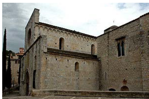
Sant Pere de Galligants