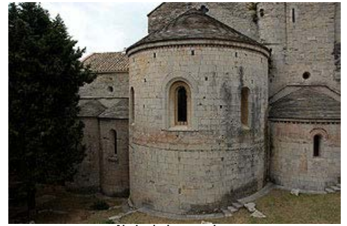
Absis de la capçalera

El lloc es va utilitzar com a caserna de la Guàrdia Civil, cosa que no va poder impedir noves inundacions que el van tornar a afectar (el 1843 i 1861). En la segona meitat de segle es va aixecar el sobreclaustre, es va restaurar i adaptar per a museu, des del 1992 és la seu gironina del Museu d'Arqueologia de Catalunya. L'església es va utilitzar regularment fins la Guerra Civil, després també va quedar incorporada al museu.