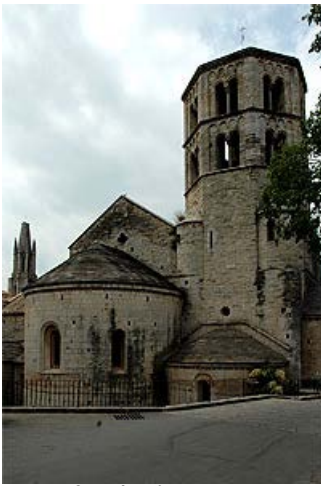
Capçalera i campanar

El lloc es va utilitzar com a caserna de la Guàrdia Civil, cosa que no va poder impedir noves inundacions que el van tornar a afectar (el 1843 i 1861). En la segona meitat de segle es va aixecar el sobreclaustre, es va restaurar i adaptar per a museu, des del 1992 és la seu gironina del Museu d'Arqueologia de Catalunya. L'església es va utilitzar regularment fins la Guerra Civil, després també va quedar incorporada al museu.