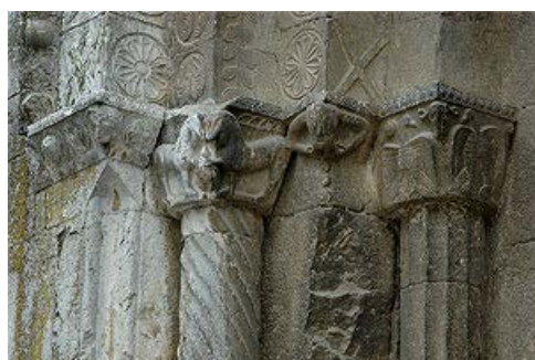
Decoració de la portada