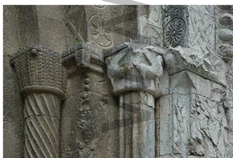
Decoració de la portada

En 1592 i en el marc d'una reorganització general, el papa Climent VIII li uní els monestirs, també benedictins, de Sant Miquel de Fluvià (Alt Empordà) i Sant Miquel de Cruïlles (Baix Empordà), que es trobaven en franca decadència. El monestir fou víctima en diverses ocasions de les inundacions ocorregudes a causa de la seva situació propera al riu Galligants. En aquest mateix sentit, va patir greument els efectes de la Guerra del Francès que va deixar l'establiment pràcticament en ruïnes. Els monjos no hi pogueren tornar fins el 1814 i no es va arribar a refer mai del tot, el 1836 fou clausurat.