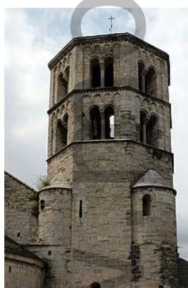
Campanar de planta octogonal

1912