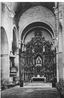
L'església a començament del segle XX