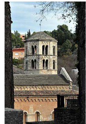
Campanar de l'església

Del conjunt monàstic es conserven l'església i el claustre d'època romànica, s'ha perdut la resta de dependències. El que encara queda és de difícil interpretació i datació a causa de les intervencions i reparacions fetes en el decurs de la seva història, les muralles, avingudes, guerres... L'església és de planta basilical amb tres naus; té un transepte irregular: al sud s'obren dues absidioles, al nord dues més però disposades de manera diferent: una a llevant i l'altra al nord. En aquest braç del transepte s'aixeca el campanar, de planta octogonal. Interiorment l'església conserva alguns capitells historiatats que s'han volgut vincular al Mestre de Cabestany. A la façana de ponent, es troba la portada que s'ha vist com un element anterior a la fàbrica de l'església actual; sobre seu es troba una rosassa que podria situar-se a cavall dels segles XII i XIII.