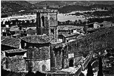
La muralla sobre la capçalera de l'església Fotografia de 1877 publicada a Girona entre 4 rius